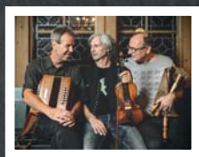
Aniada a Noar