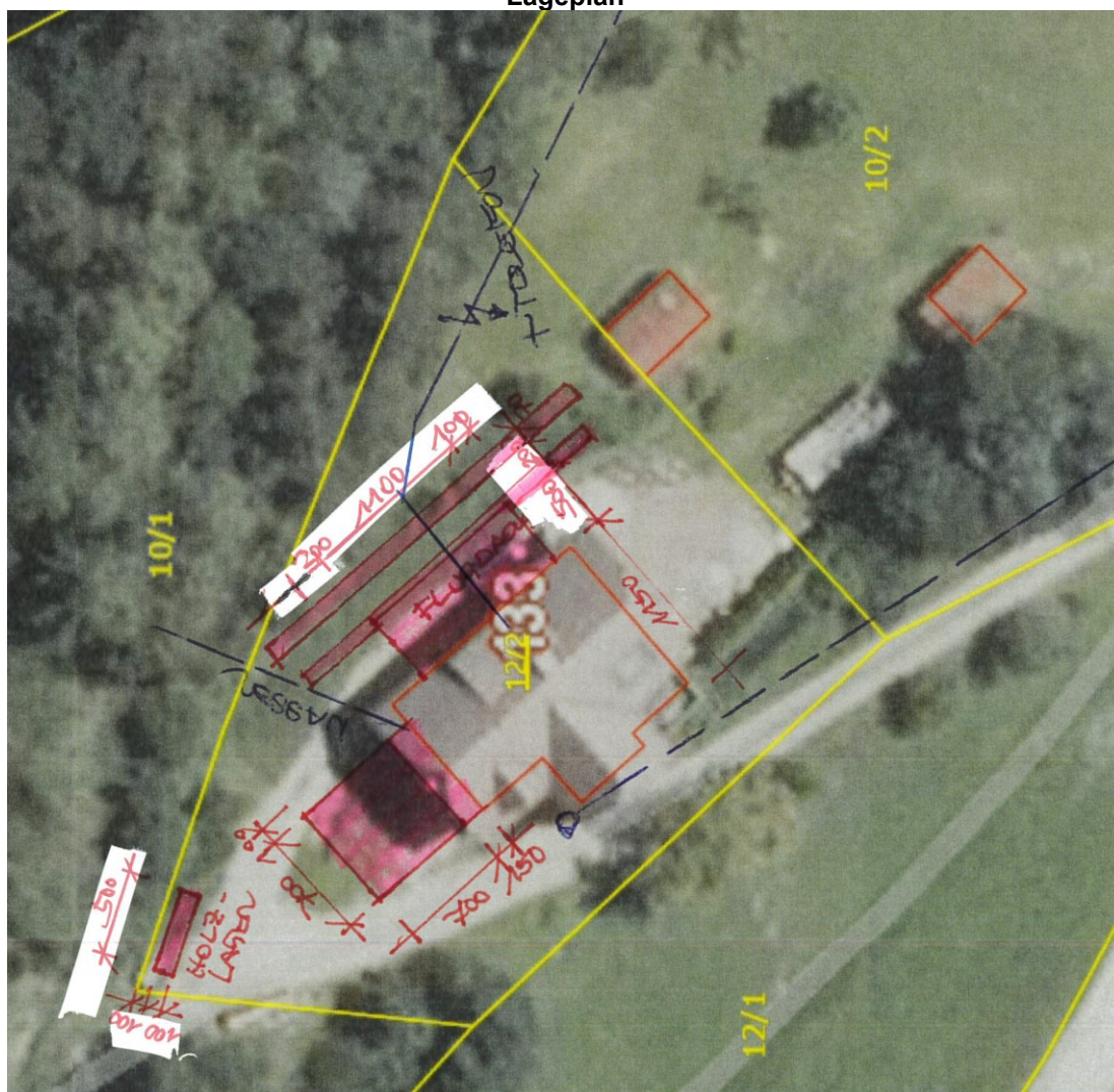
Achtung – Plandarstellung ohne Maßstab!