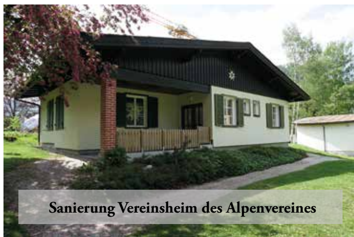
Sanierung Vereinsheim des Alpenvereines