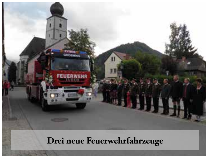
Drei neue Feuerwehrfahrzeuge