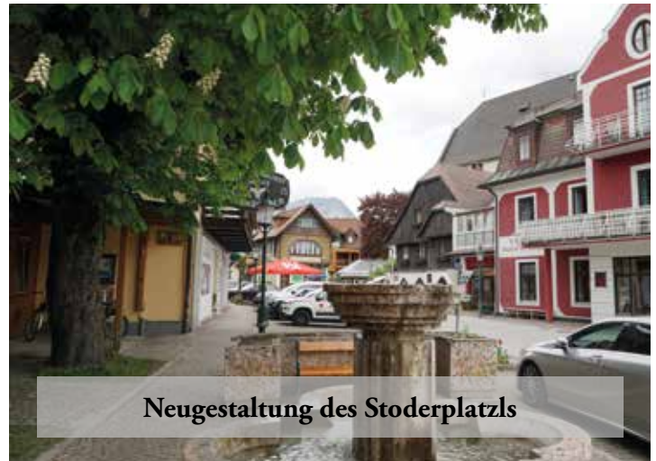
Neugestaltung des Stoderplatzls