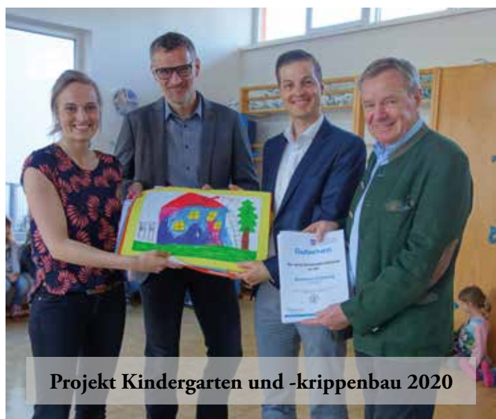
Projekt Kindergarten und -krippenbau 2020