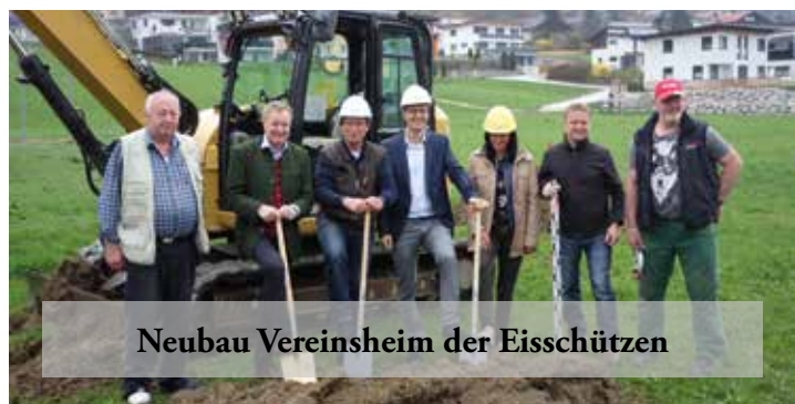
Neubau Vereinsheim der Eisschützen