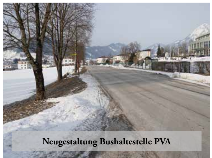
Neugestaltung Bushaltestelle PVA