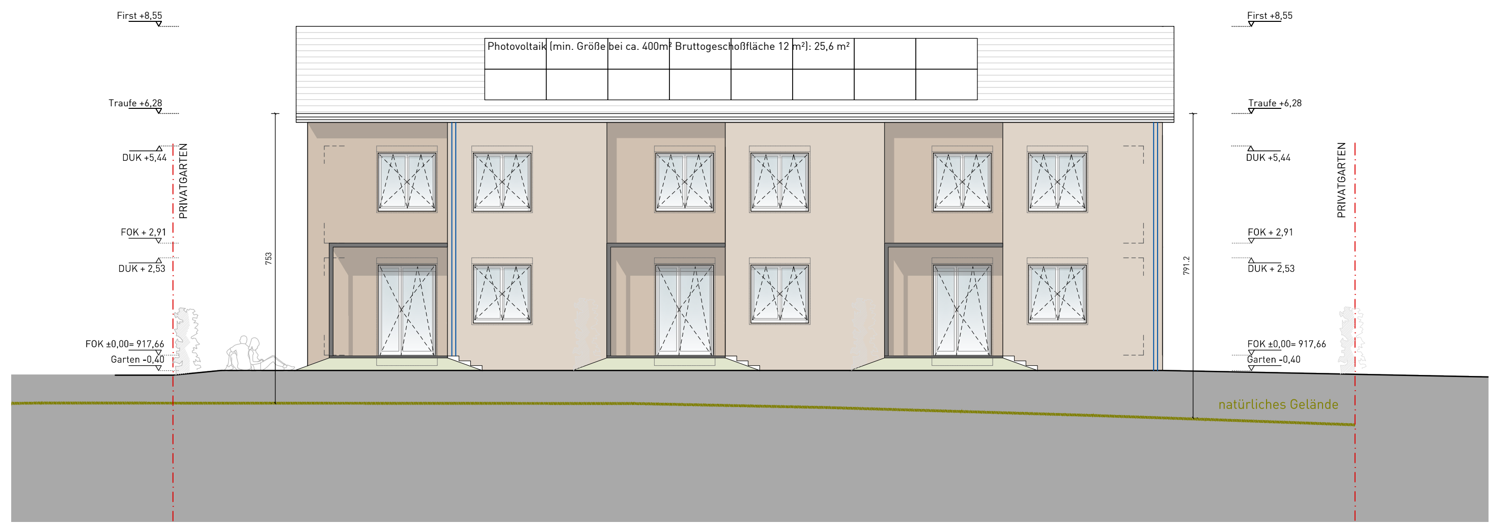
ANSICHT SÜD-WEST | 1:100