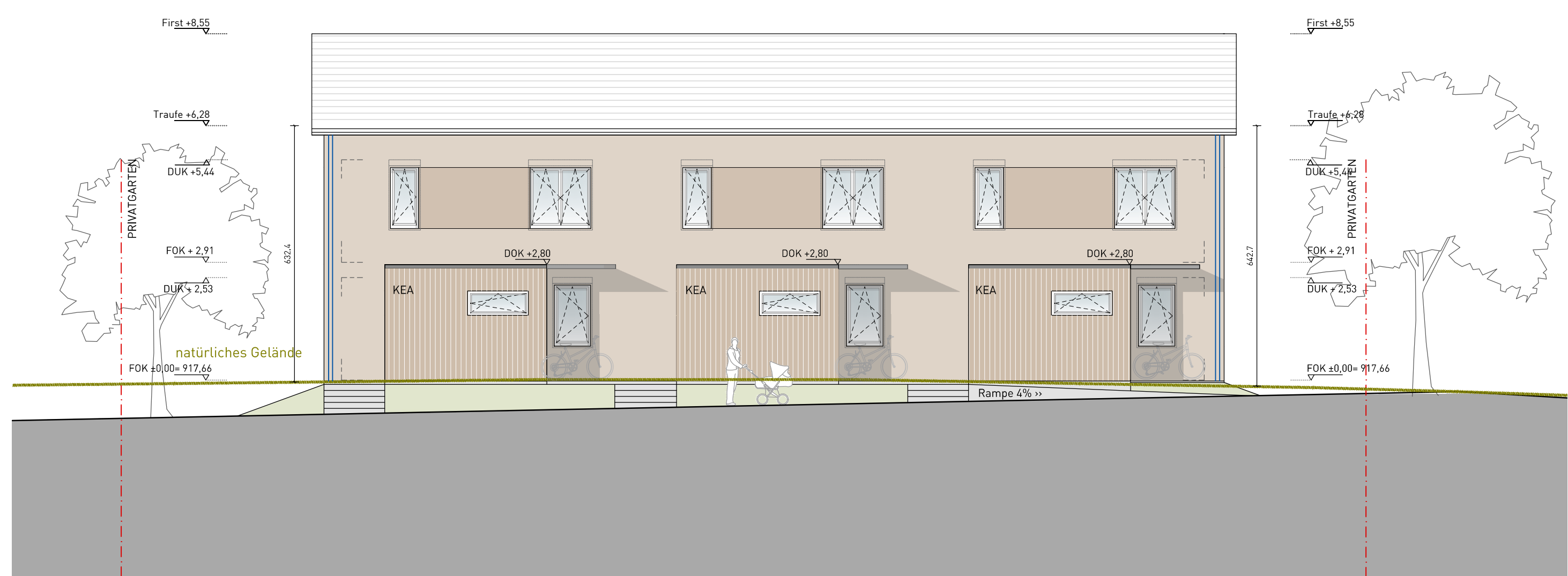
ANSICHT NORD-OST | 1:100