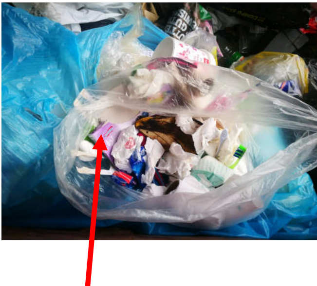
Restmüll, Bioabfall, etc.

Zur Veranschaulichung sind anbei Fotos des Containers für LEICHTVERPACKUNGEN abgebildet: