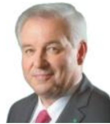
Hermann Schützenhöfer Landeshauptmann der Steiermark

„Unsere Steiermark gehört zu den lebenswertesten Regionen Europas. Das liegt gleichermaßen an der Landschaft und an den Menschen. Die vergangenen Monate der Krise haben uns ganz deutlich vor Augen geführt, wie wichtig das Zusammenleben in einer Gemeinschaft ist. Wir alle brauchen Orte und Gelegenheiten der Begegnung und des Austauschs. Hierbei spielen die Gemeinden der Grünen Mark eine bedeutende Rolle. Die eingereichten Projekte zur Prämierung als Zukunftsgemeinde zeigen allesamt eindrucklich, mit welcher verschiedenen Zugängen eine wichtige Botschaft vermittelt wird: Die Botschaft der Dankbarkeit und der Zuversicht für die Zukunft. Allen Beteiligten gilt ein großer Dank dafür, dass sie Zeichen für Wege aus der Krise setzen und diese auch sichtbar machen!“