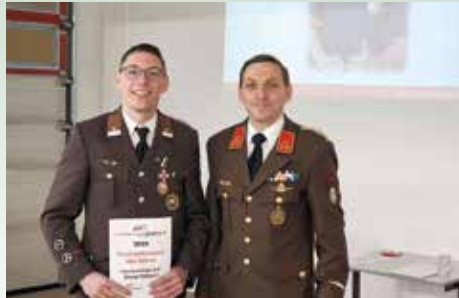
Feuerwehrmann des Jahres

Danke an dieser Stelle für die gute Bewirtung durch das Ehepaar Rud!