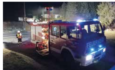
Verkehrsunfall auf der L 601