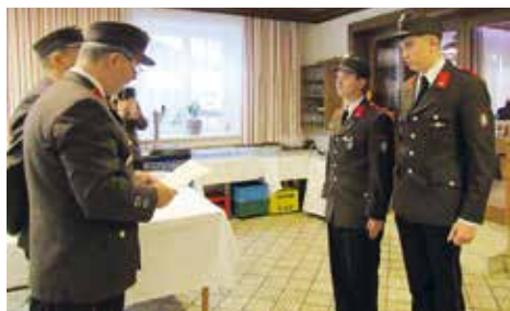
Angelobung bei der Wehrversammlung

Gerne laden wir Sie jetzt schon ein, unsere Veranstaltungen zu besuchen. Am Samstag, 31.8.2024 wird unser traditionelles Ripperlgrillen stattfinden. Als besonderes Highlight werden wir am Sonntag dem 1.9.2024, unser neues Mannschaftstransportfahrzeug segnen. Mittendrin stecken auch bereits die Planungen für das 120-jährige Gründungsfest im Jahr 2025. Sollten Sie den unbändigen Drang verspüren, sich am Fest aktiv beteiligen zu wollen, nehmen Sie Kontakt mit uns auf – wir freuen uns über Ihre Unterstützung!