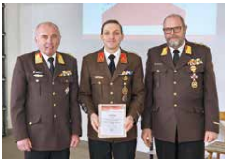
Steirisches Leistungsabzeichen in Silber