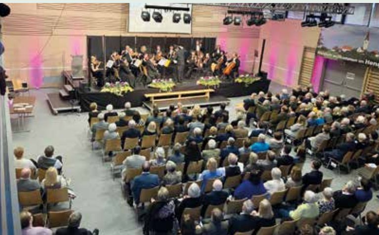
Sehr gut besucht war das Hengistzentrum anlässlich des 12. Neujahrskonzertes.