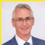
Dir. Josef Adam

Fragen Sie Ihren Berater nach Ihrer individuellen Wohnbaufinanzierung. Die MitarbeiterInnen der Raiffeisenbank Wildon-Preding freuen sich auf Ihren Besuch!