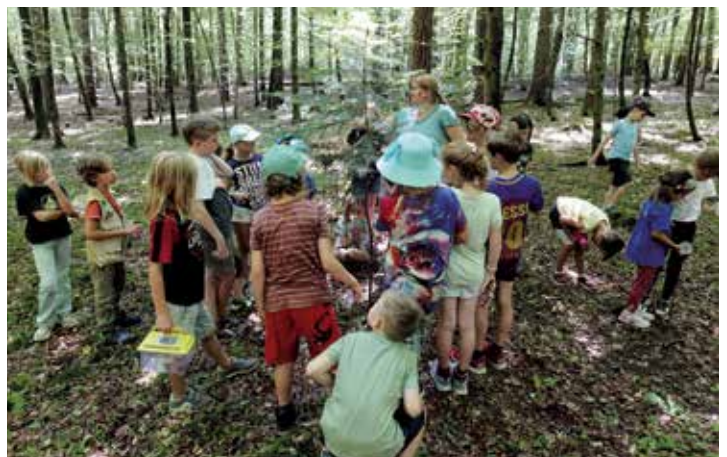
Auch heuer gibt es in Hengsberg wieder die beliebten Walderlebnistage!

Der Kulturpark Hengist wird gefördert von