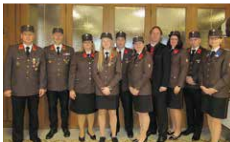
„Ausgezeichnete“ Kameradinnen und Kameraden