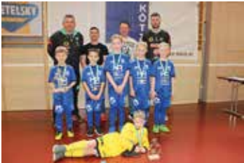
1. Platz SV Wolfsberg U8