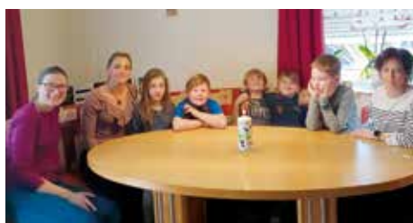
„Wer teilt gewinnt!“

Vieles wurde mit der Unterstützung des Elternvereines in diesem Schuljahr bereits bezahlt und unterstützt. Vielen Dank für das E-Piano, für Schulbücher, für den Trommelworkshop, für Lernspiele, für die Übernahme von Buskosten, für gefüllte Nikolaussackerl und für täglich frische Äpfel!