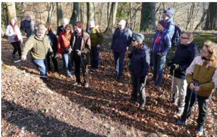
Am 3. Februar fand unsere erste Veranstaltung im heurigen Jahr statt – eine geführte Wanderung auf den Wildoner Schlossberg

Weitere Informationen zur Mitgliedschaft, Veranstaltungen oder zum Verein finden Sie auf unserer Homepage: www.hengist.at ; E-Mail: info@hengist.at oder telefonisch unter 0676/5300575.