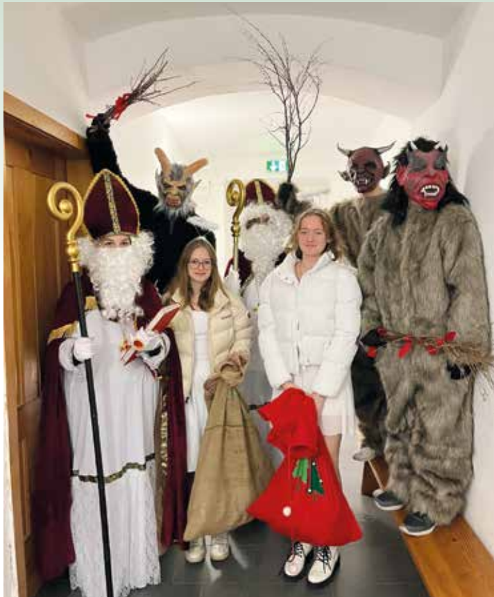
Die Nikoläuse mit ihren Begleitern