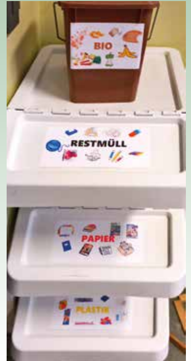
Wir passen auf – wir sammeln Reste – wir trennen richtig!