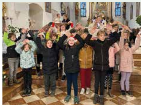
Wir feiern den Advent

und bewirkt viel Gutes. Die Schule als einen Ort der Freundlichkeit zu machen, ist ein Ziel, das wir uns vorgenommen haben. Zum Gelingen braucht es jede und jeden von uns.