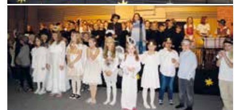
Viele Festgäste erfreuten sich herzlichster Darbietungen!