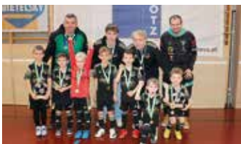
1. Platz Young Panthers Tillmitsch U7