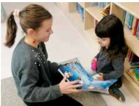
Vorlesen in der Kinderkrippe

Alle waren begeistert und der Wunsch auf eine Wiederholung ist auf beiden Seiten groß.