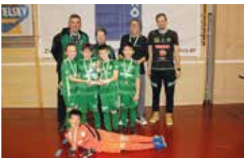
1. Platz Ragnitz A U9

Der USV Kötz Haus Hengsberg wünscht allen Hengsberger*innen ein schönes Osterfest im Kreise eurer Liebsten!