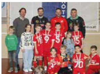
1. Platz SV Flavia Solva U10