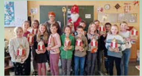
Wir feiern besondere Tage im Advent.

Besuch, dass die Familiengottesdienste motivieren, Traditionen mit neuem Leben zu füllen.