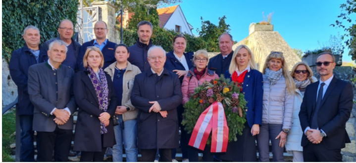
Kranzniederlegung zu Allerheiligen