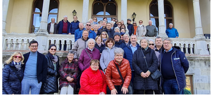
Draßburger Pensioniste: Ausflug nach Schloss Rotenturm