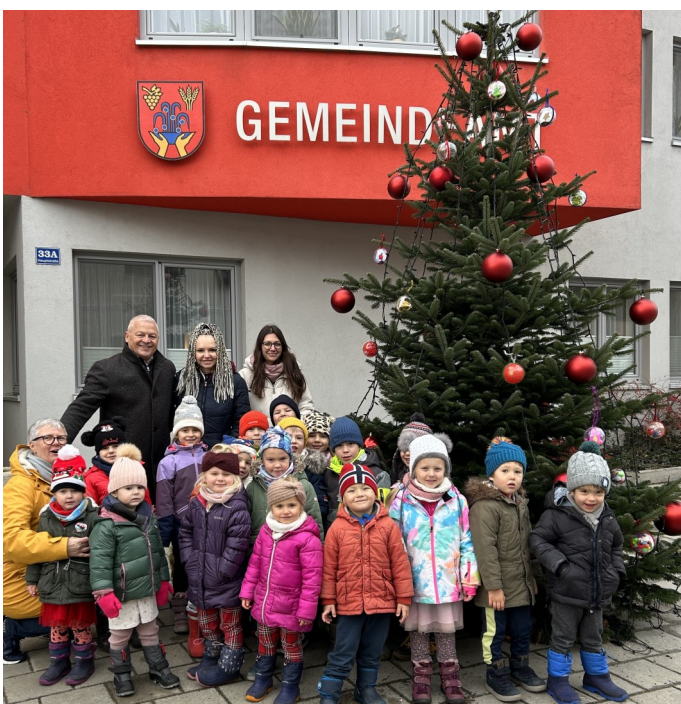
Gerald Handig, Bürgermeister

Ich wünsche Ihnen besinnliche Weihnachten, schöne Feiertage, sowie einen guten Rutsch und Gesundheit im neuen Jahr 2024.