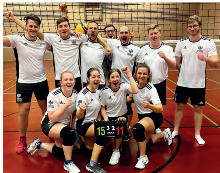
Sieg gegen VSC Turbos

ren Sieg im ersten Satz, mussten unsere Herren jedoch einen Satz an die Gegner abgeben. Danach konnte es kaum spannender sein: die letzten Kräfte wurden nochmals gesammelt und es wurde um jeden einzelnen Punkt gekämpft. Mit Erfolg! Unseren Herren gewinnen 3:1 und spielen damit im Frühjahr um den Aufstieg in die 2. Landesliga.