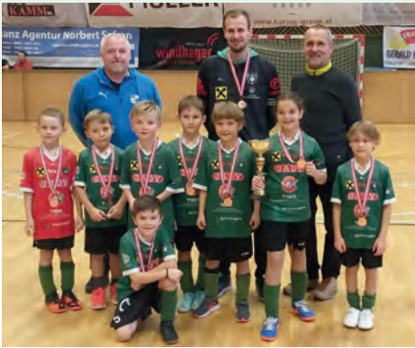
Die Spieler/innen der U8 belegten den 2. Platz in Gnas