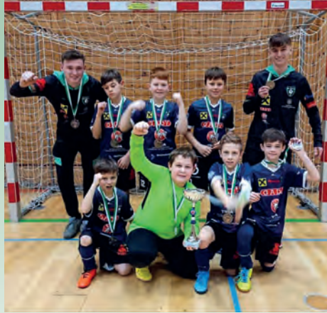
Unsere U11 erreichte den 3. Platz in Leibnitz