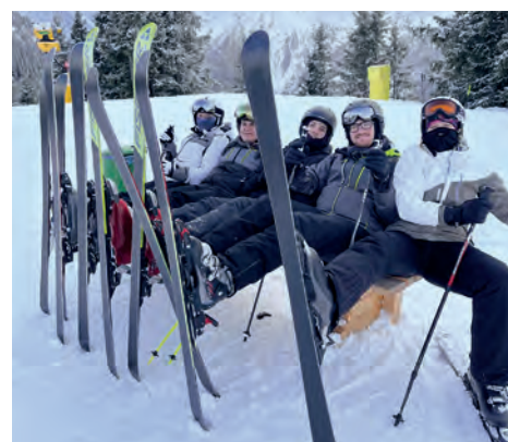
Wintersporttage in Schladming

Ende Dezember veranstalteten wir zum ersten Mal unsere Landjugend-Wintersporttage in Schladming. Zeitig in der Früh machten wir uns auf den Weg auf die Planai, um die Ersten auf der Piste zu sein. Nachdem von allen Mitgliedern fleißig Pistenkilometer gesammelt wurden, stand Après Ski am Programm. Am zweiten Tag spielten wir Billard und hatten Spaß beim Nachtrodeln und Nachtskifahren auf der Hochwurzen. Am letzten Tag stateten wir der Erlebnis-Therme Amadé einen Besuch ab. Nach diesen gelungenen Wintersporttagen ist die Vorfreude auf die nächsten riesig.