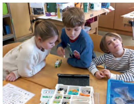
Mit LEGO WeDo auf dem Weg zur Expertschule.

LEGO WeDo Baukästen arbeiten und forschen. Mit dem Konzept von LEGO sollen die Motivation und das Interesse von Grundschulkindern an naturwissenschaftlichen und technischen Themen gefördert werden. Das Prinzip basiert auf motorisierten LEGO-Modellen sowie einfachem Programmieren.