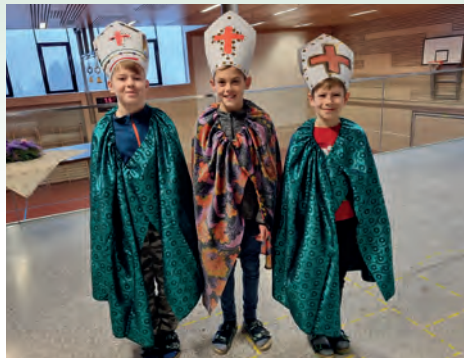
Wir feiern besondere Tage im Advent!

Ganz genau wurde uns diese um 17.00 Uhr in der Kirche vor Augen geführt. Von den Bischöfen der 4. Klasse wunderschön vorgelesen, spielten die noch gesunden Chorkinder die Legende