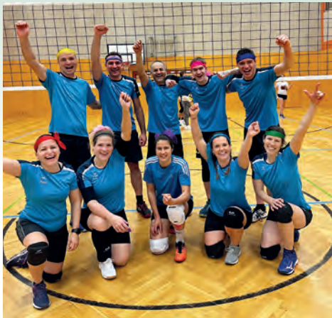
Sieg gegen Roter Sturm