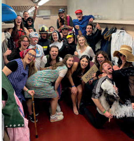
Bereit für die Mitternachtseinlage

Am 21. Jänner fand nach dreijähriger Unterbrechung der 5. Hengistball gemeinsam mit dem Musikverein Hengsberg statt. 14 Paare unserer Landjugend und des Musikvereins tanzten die Polonaise. Im Anschluss schenkten wir Getränke in der