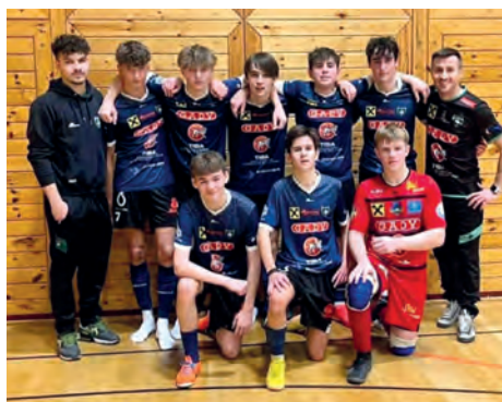
Den 2. Platz in Leibnitz konnte sich unsere U17 sichern