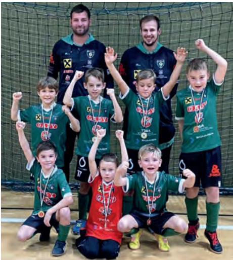
Unsere U8 erreichte