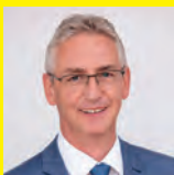
Dir. Josef Adam

Fragen Sie Ihren Berater nach Ihrer individuellen Wohnbaufinanzierung. Die MitarbeiterInnen der Raiffeisenbank Wildon-Preding freuen sich auf Ihren Besuch!