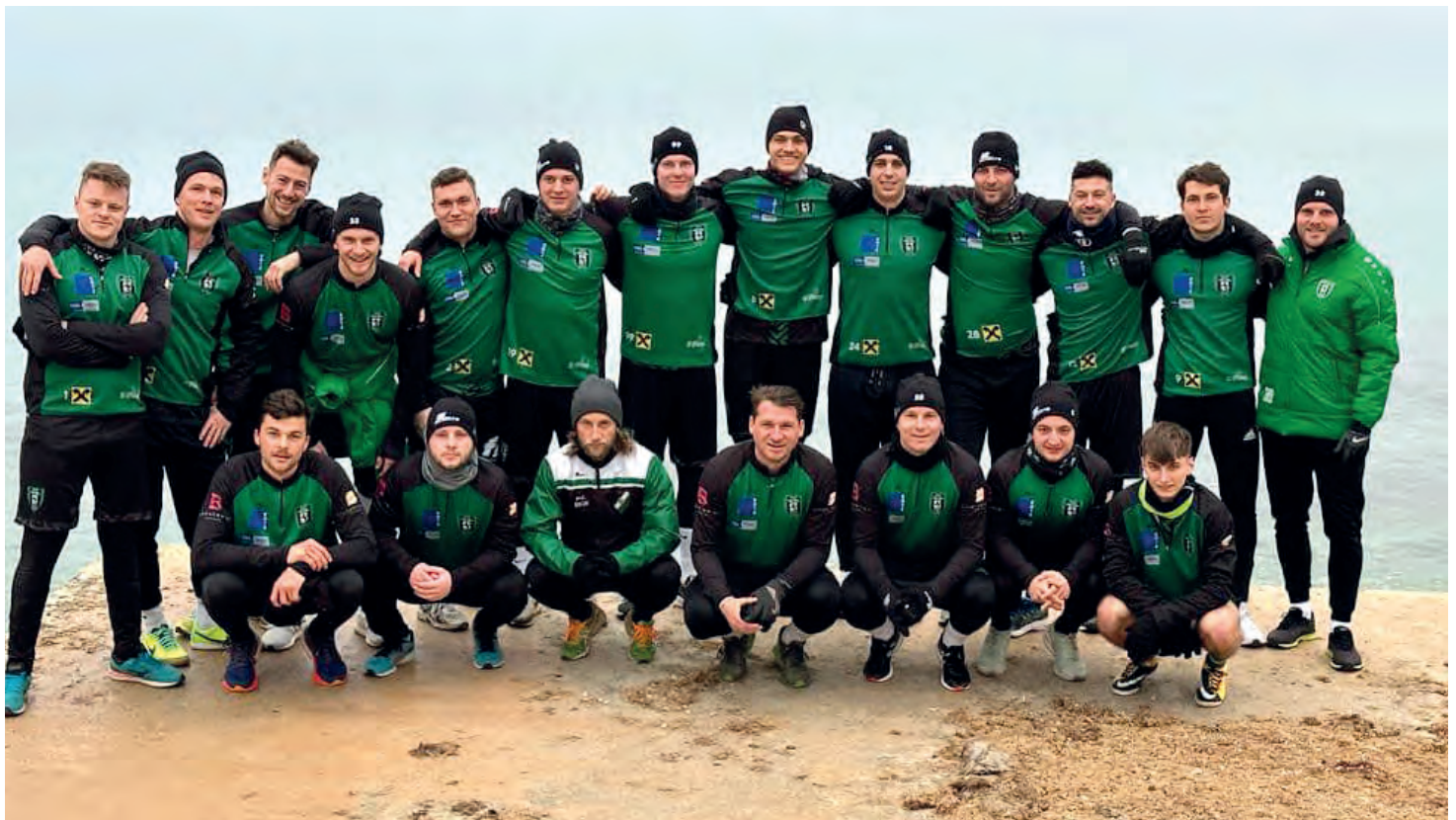
Unsere Mannschaft beim Trainingslager in Umag

100% Herz 100% Leidenschaft 100% USV Kötz Haus Hengsberg