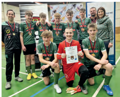
Den 1. Platz in Kirchbach erlangte unsere U15