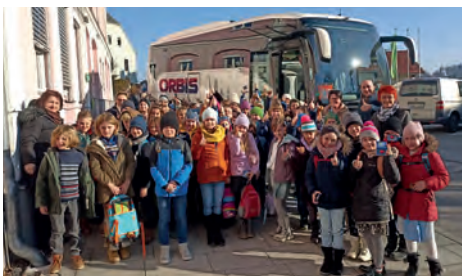
Frau Holle – So wird das Wetter gemacht!