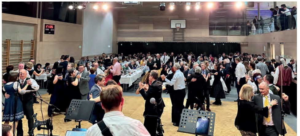
Die tanzbegeisterten Besucher kamen voll auf ihre Kosten