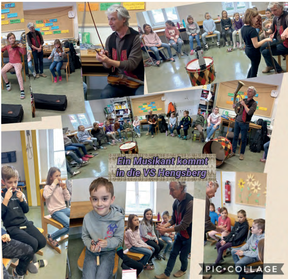
Ein Musikant kommt in die Volksschule