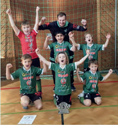
Unsere U8 belegte des Weiteren den 3. Platz in Wettmannstätten