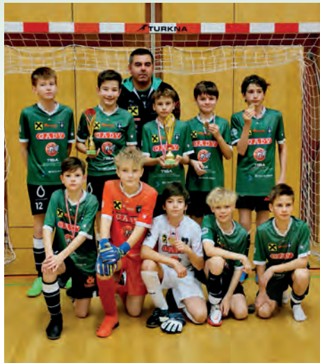
Unsere U13 belegte den 2. Platz in Preding