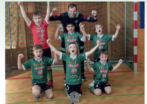
Unsere U8 belegte den 3. Platz in Straden