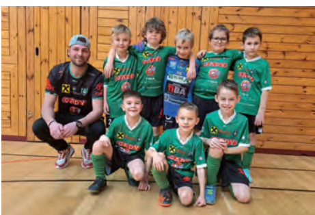
Unsere U9 besetzte den 3. Platz in Leibnitz