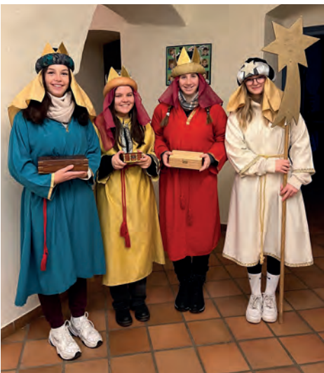
Sternsingergruppe in Schröten