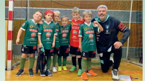
Den 5. Platz in Wagna belegte unsere U7