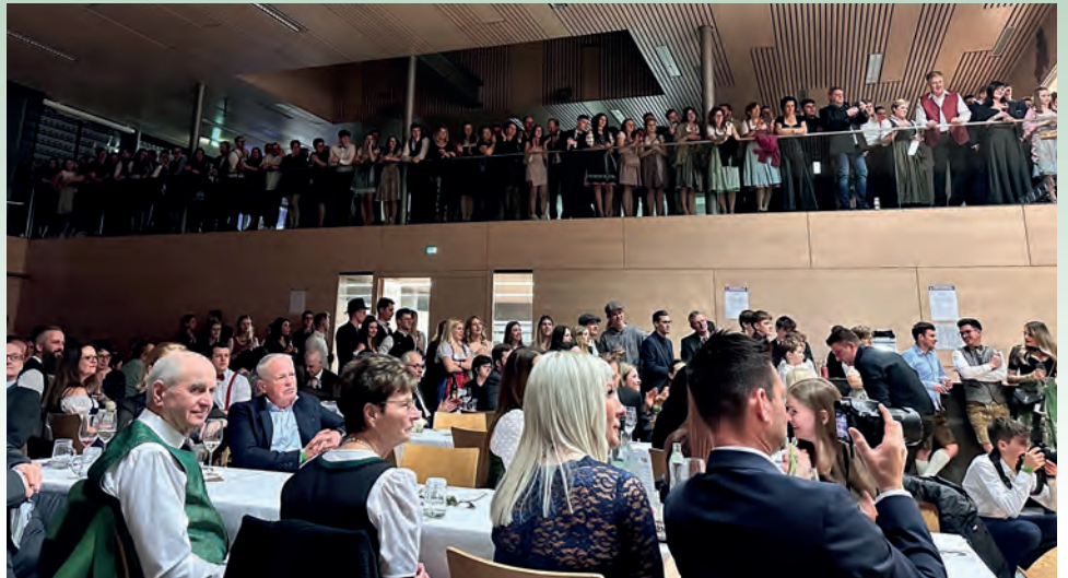
Volles Hengistzentrum beim 5. Hengist Ball

Neben den vielseitigen Ensembles durften auch ein musikalisches Schätzspiel und eine Mitternachtsshow an unserem Ballabend natürlich nicht fehlen, sodass den Besuchern ein abwechslungsreiches Unterhaltungsprogramm geboten wurde. Ein herzlicher Dank geht an alle Mitwirkenden, Gönner und Sponsoren sowie an die zahlreichen Gäste – Sie alle haben zum Gelingen dieser großartigen Veranstaltung beigetragen und sie zu einem unvergesslichen Erlebnis gemacht!