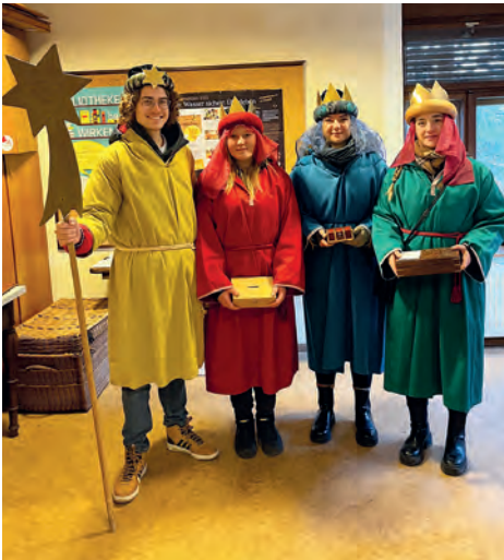
Sternsingergruppe in Kehlsdorf

Das neue Jahr begann für uns mit der Sternsingeraktion. Dabei gingen zwei Gruppen von uns von Haus zu Haus und sammelten mit der Pfarre Hengsberg Spenden für sauberes Trinkwasser in Kenia. Wir möchten uns für Ihre großzügigen Spenden bedanken.