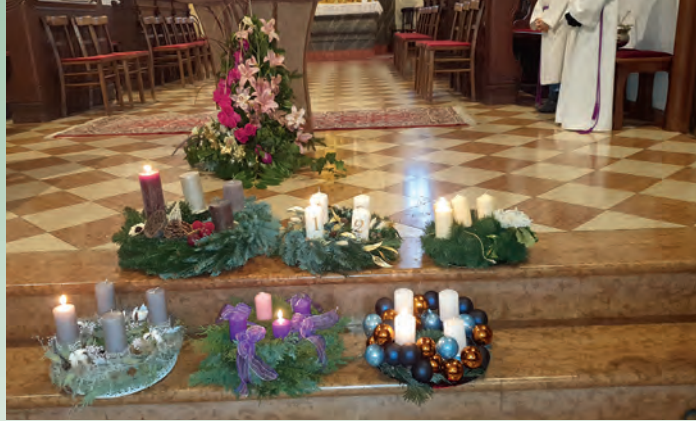
Wir feiern den Advent!

Wie bei uns üblich, versammelten wir uns am 28.11.2022 zur Adventkranzsegnung in der Kirche. Die von den Eltern wundervoll gestalteten Adventkränze standen dabei im Mittelpunkt. Auch im Advent sollten wir das Jahresthema vom guten Erdreich für Gottes Wort nicht vergessen, daher brachte uns die 4. Klasse einen besonderen Adventkalender nahe.