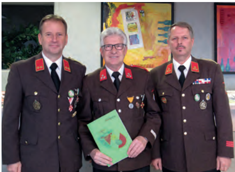
Das Kommando gratuliert zur Ernennung „Ehrenlöschmeister“

Allgemein gilt, dass jeder Haushalt für seine Blackout-Vorsorge selbst verantwortlich ist. Es wird seitens der Gemeinde genügend Infomaterial zur Verfügung gestellt, sodass ein Versäumnis der eigenen Pflichten entgegengewirkt werden kann.