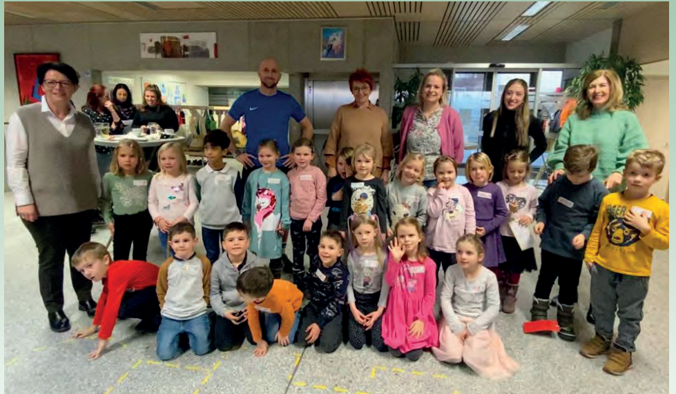
Unsere 21 künftigen Schulanfänger:innen – „Bald bin ich ein Schulkind!“

Am 7.2.2023 luden wir die Schulanfänger:innen zum Einschreibfest ein. 21 entzückende, wissenshungrige und begeisterte Kinder wohnten dem Fest bei. Das Lehrerteam unserer Volksschule arbeitete mit den Kindern in verschiedensten Kompetenzbereichen, um nicht nur für gelungene und spannende Abwechslung zu sorgen, sondern auch, um ohne überfordernde „Screenings“ auf ein stressfreies, von den Kindern mit Freude erledigtes Schulreifeergebnis zu kommen. Unsere Schulbuchlieferantin, Frau Petritsch aus Leibnitz sorgte mit ihrer Schultaschen- und Buchausstellung für Begeisterung bei den künftigen Schulanfänger:innen und so manches Kind sehnte nun den Schulstart herbei. Dem Elternverein sei herzlich für die Bereitstellung von Kaffee und Kuchen gedankt. Mit einem kleinen Geschenk, überreicht von sehr engagierten Mamas des Elternvereines, verließen die Kinder das gelungene „Schuleinschreibungsfest“.