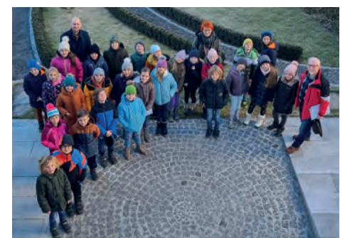
Danke für die interessanten Ausführungen!