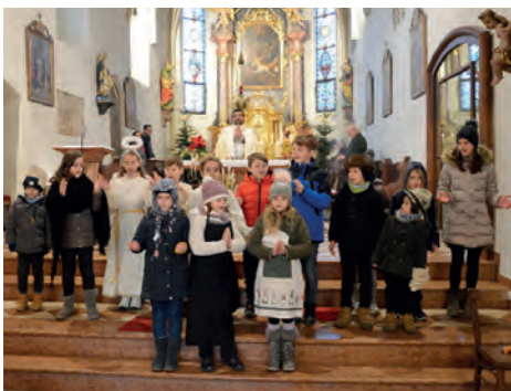
Erste Kindermette in Hengsborg

Mikrofon durch den ganzen Raum der Kirche eine weihnachtliche Atmosphäre verbreiteten. Der Frauenbewegung war es zu verdanken, dass es auch noch selbstgemachte Geschenke für die zahlreichen Besucher und Besucherinnen gab. Wir freuen uns schon auf die nächste Mette und viele begeisterte Mitgestalter und Mitgestalterinnen