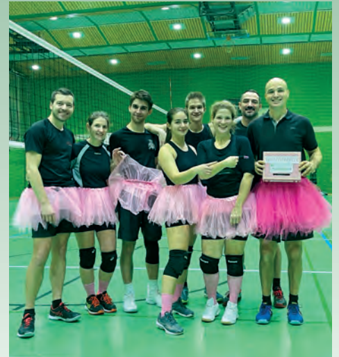
Baller die Waldfee

Doch das nicht nur zur Gaudi: Die Mannschaft hat das Turnier dafür genutzt nebenbei bei den Gegnern Spenden für die Organisation Kinderhilfswerk zu sammeln. Dabei kamen €157,40 zusammen, die wir an die Organisation übergeben haben.