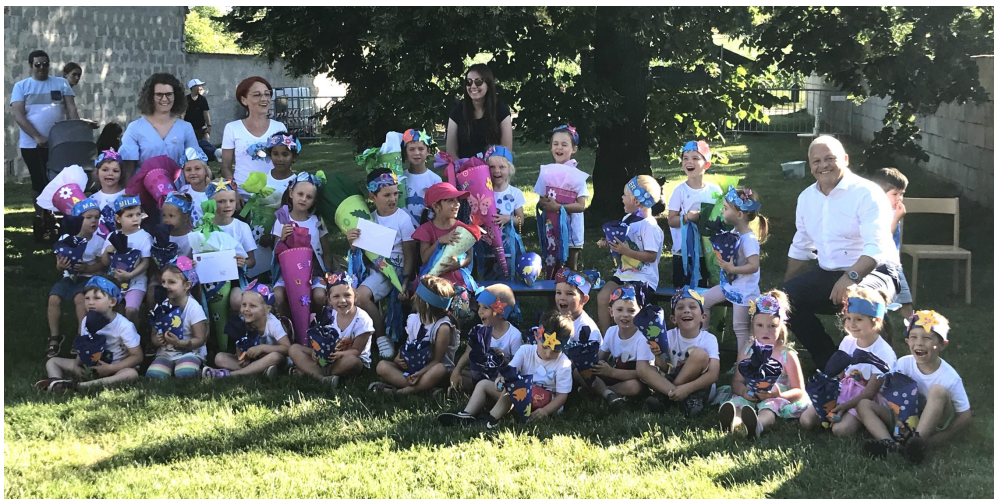
Beim Abschlussfest freuen sich unsere Kindergartenkinder auf die Ferien

einzuleiten, vorweg jene der ungeraden Hausnummernseite. Mit dieser ökologischen Maßnahme wird folglich das Regenwasser nicht mehr entgeltlich in die Kläranlage geschickt, sondern nach Rückhaltung im (Karpfen)teich, über den Wiesgraben in die Kleine Leitha abgeleitet und bleibt dadurch dem natürlichen Wasserkreislauf erhalten.