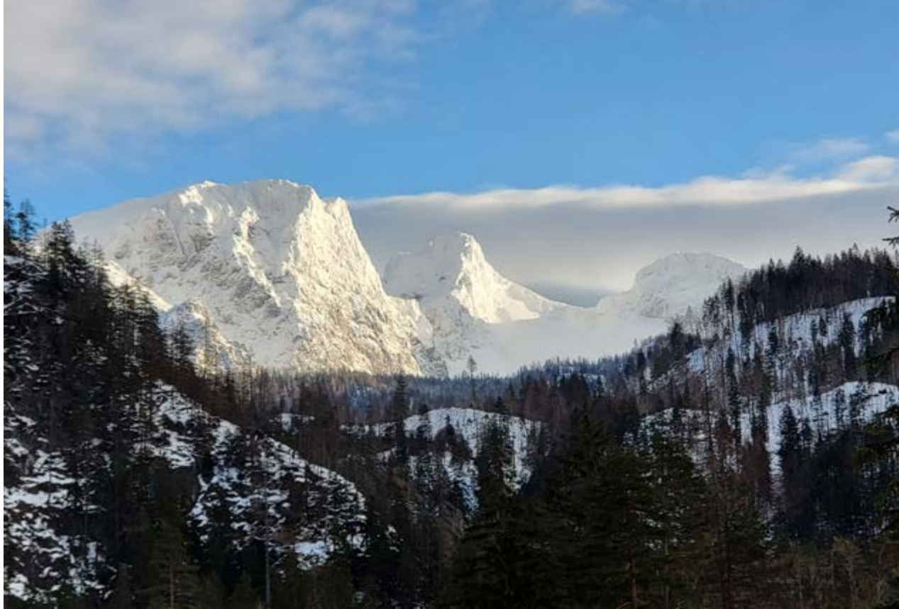
Griesstein, Ebenstein und Schaufelwand mit Föhnwind