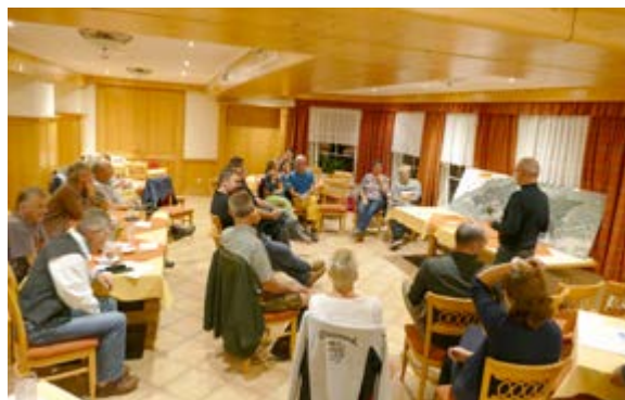
Öffentliche Auftaktveranstaltung am 18. Oktober beim Stiegenwirt in Palfau bei der aktiv an einer „Wirtshauskarte“ gearbeitet wurde.

„Wir freuen uns, dass wir mit diesem Projekt wesentliche Stakeholder aus der Region an einem Tisch versammeln und damit partizipativ die Aus-