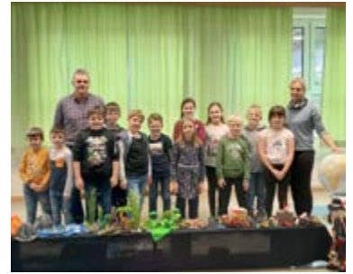
Aktivitäten des laufenden Schuljahres auf der Gemeindehomepage.