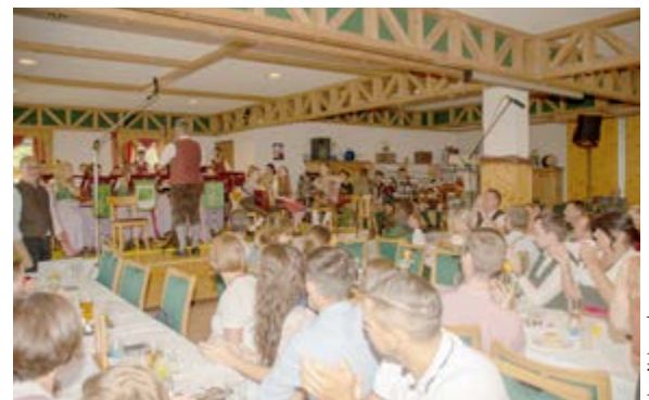
20 Jahre Geopark Frühschoppen im Forstauer's Brauhaus, Gams

20 Jahre Natur- und Geopark Steirische Eisenwurzen