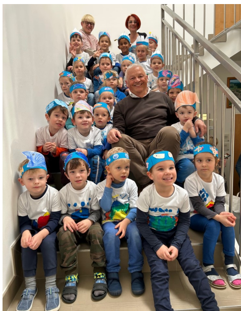
Fasching im Kindergarten