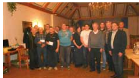
Siegerehrung vom Kegeltturnier des ÖKB Windisch-Minihof im Gasthaus Hirtenfelder.