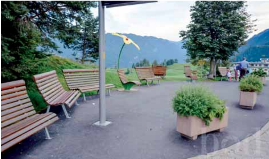
Verbesserung Warteplatz Wanderbus