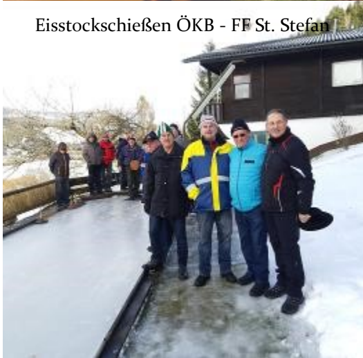
Eisstockschießen ÖKB - FF St. Stefan