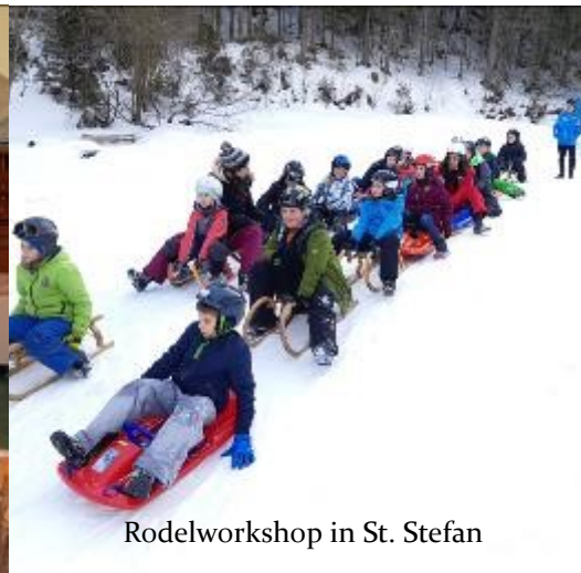
Rodelworkshop in St. Stefan