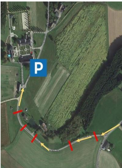
(Schloss Tannbach, Güterweg Schöferhof II, Gutau)