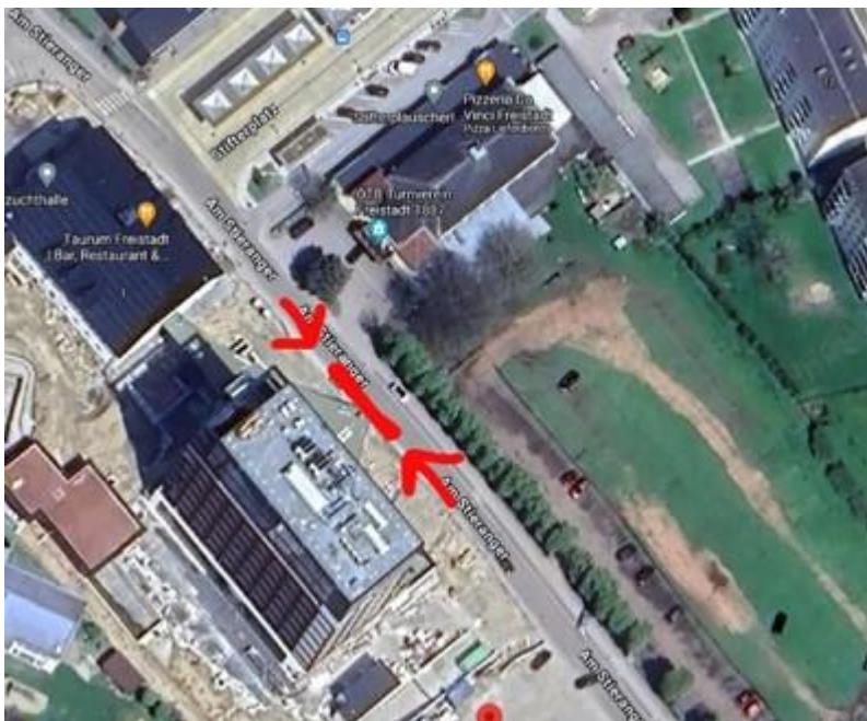
(Hotel Freigold, Gemeindestraße Am Stieranger)