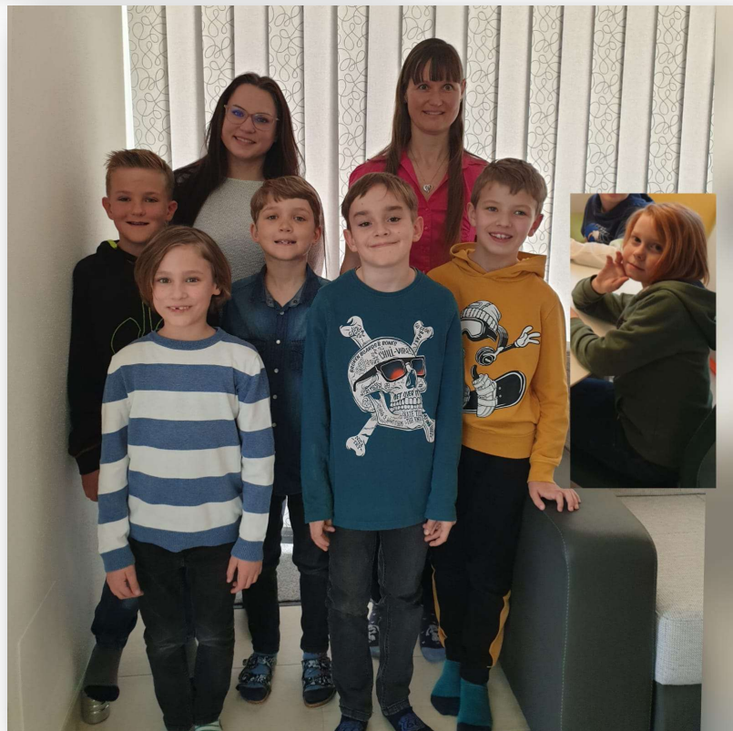
„Wachsen unter Gottes Segen“