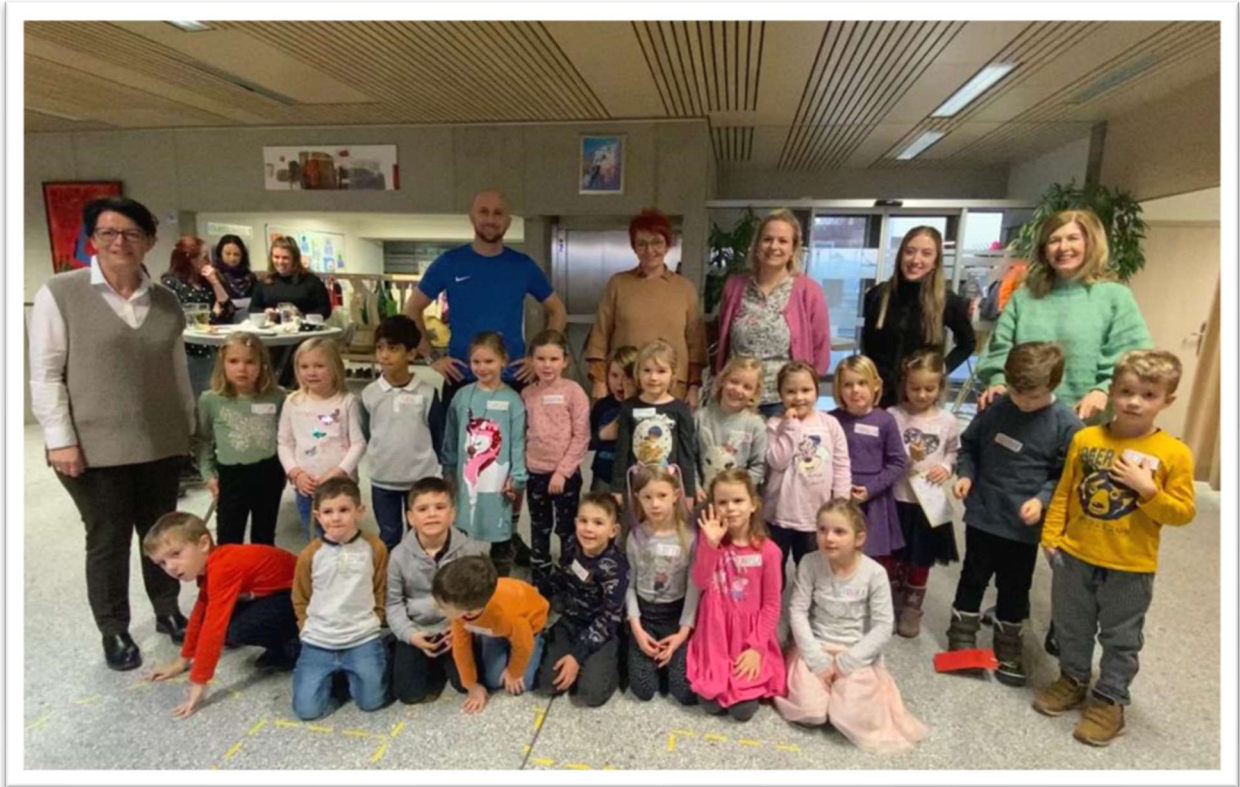
Unsere 21 künftigen Schulanfänger:innen – „Bald bin ich ein Schulkind!“