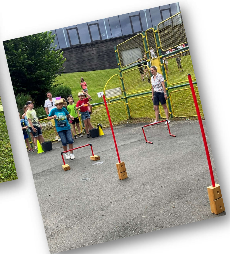
Ein lustiger Abschluss des Schuljahres