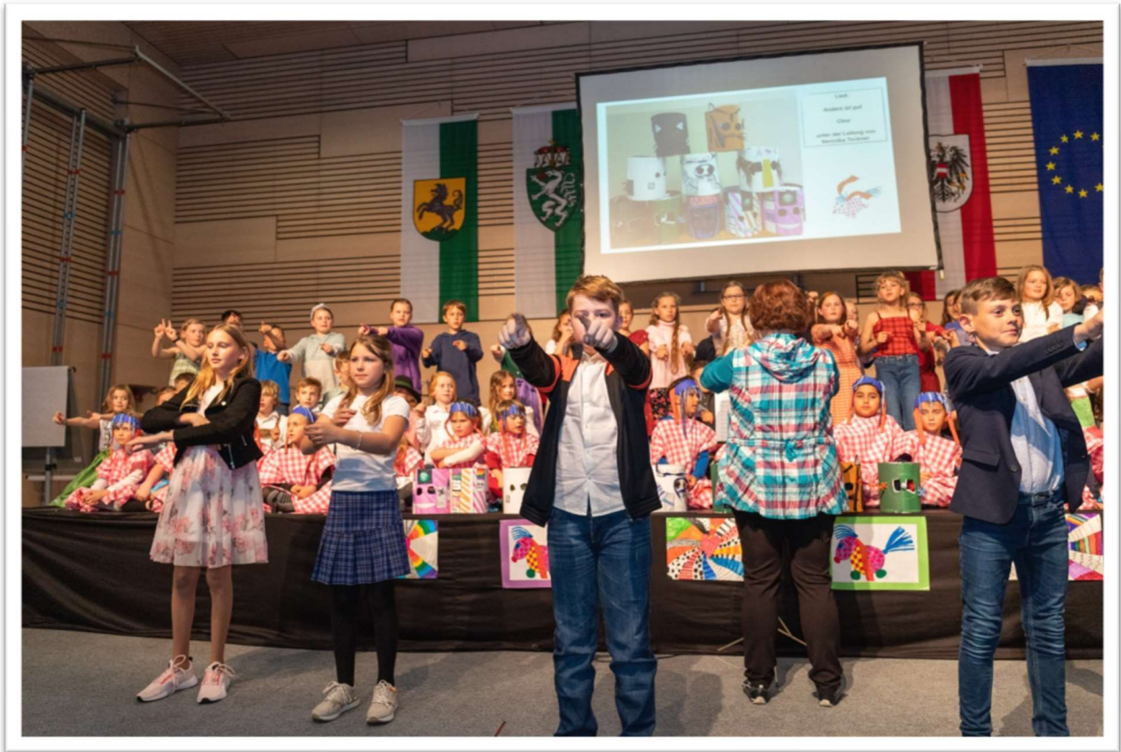
Viele Festgäste erfreuten sich herzlichster Darbietungen!