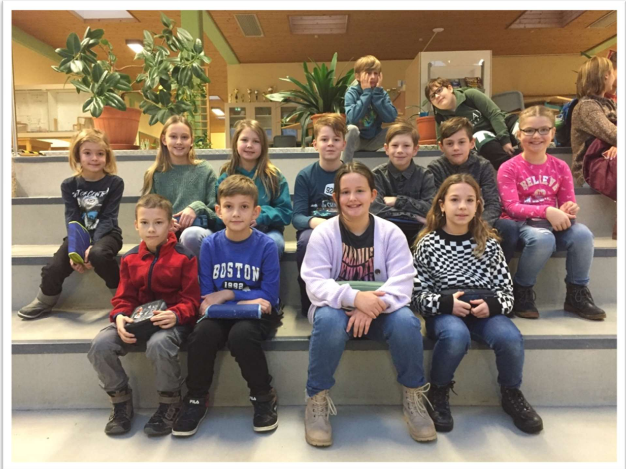
Nahtstelle VS Hengsberg - MS Lebring St. Margarethen