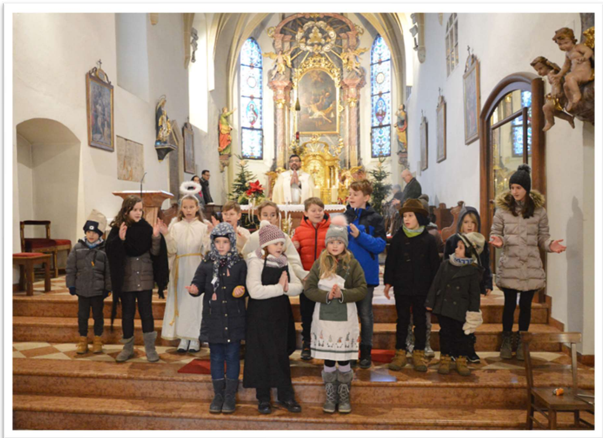
Erste Kindermette in Hengsberg