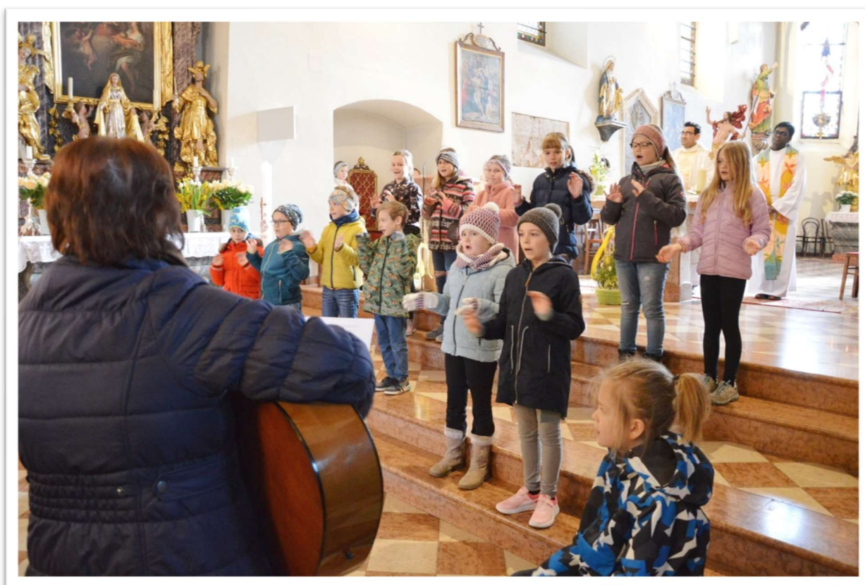
Familiengottesdienst gestaltet von unserem Schulchor

Natürlich war die Suche nach den Überraschungen wieder ein absolutes Highlight für alle anwesenden Kinder, die nicht nur die Süßigkeiten bestaunten, sondern die liebevoll gehäkelten Küken, die ihnen aus den Nestern entgegenlachten. Bei so viel Liebe zum Detail war es nicht schwer echte Begegnung zu leben.