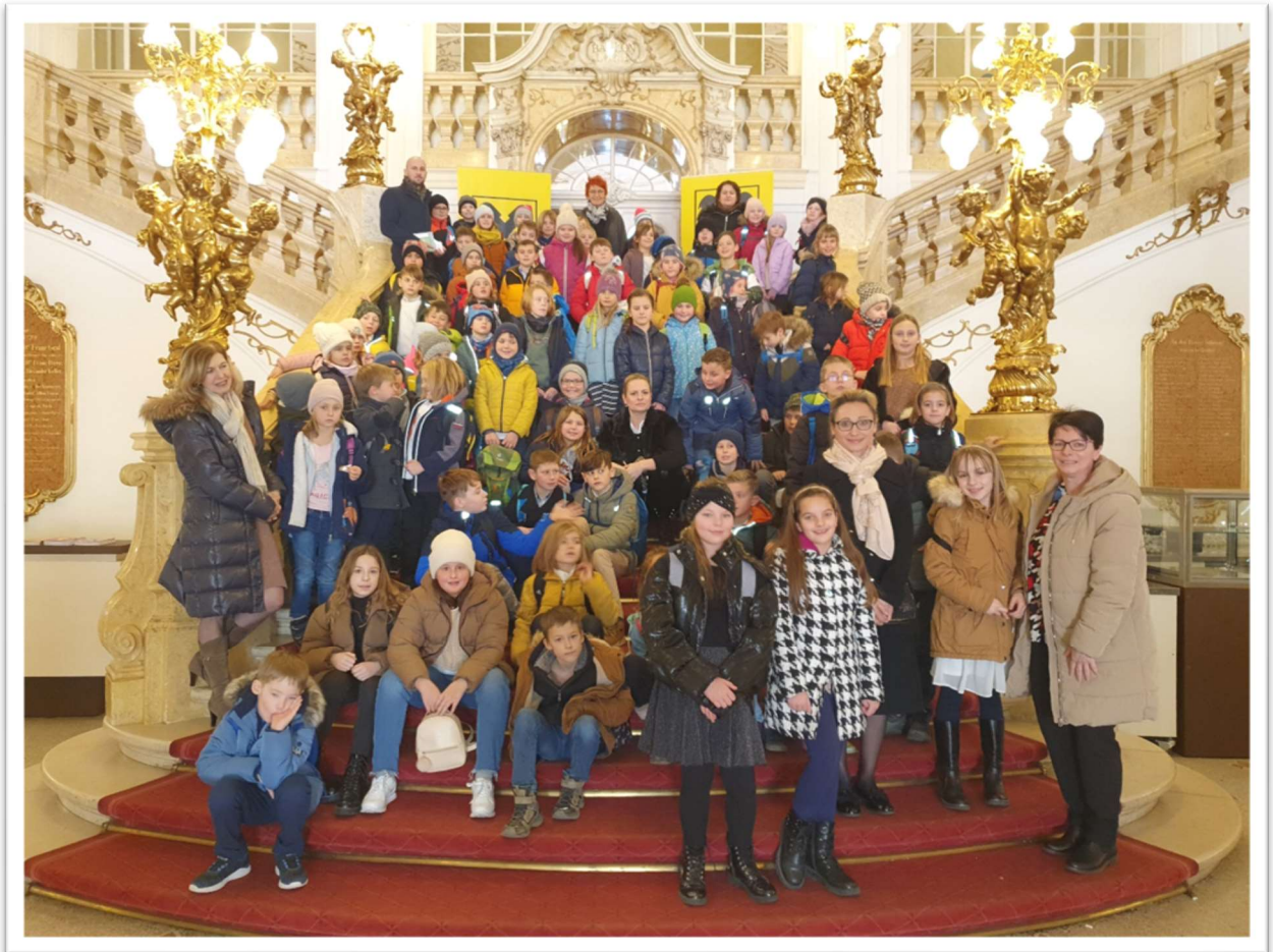
Frau Holle – So wird das Wetter gemacht!

Besonderer Dank ergeht an die Raiffeisenbank Wildon-Preding für die Mitfinanzierung der Eintrittskarten! Für die Übernahme der gesamten Buskosten sei herzlichst unserem Elternverein gedankt!!