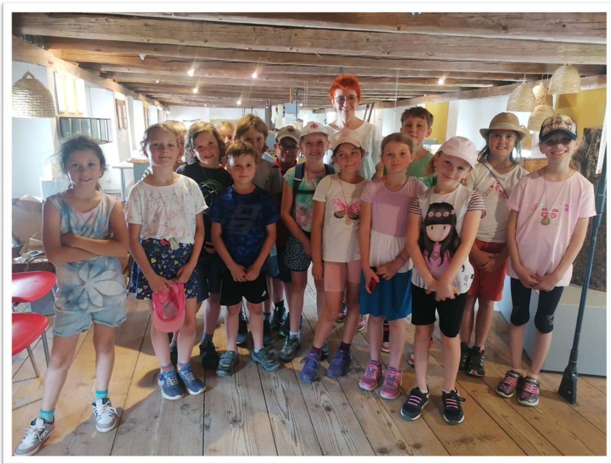
Unser Heimatbezirk Leibnitz