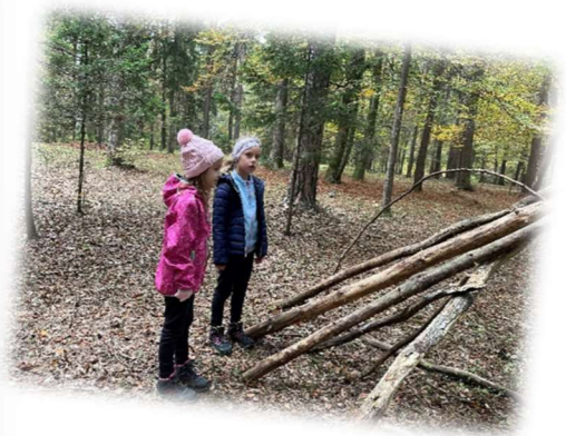
Ein herbstlicher Waldtag