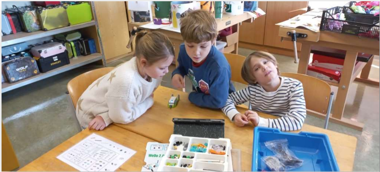
Mit LEGO WeDo auf dem Weg zur Expertschule