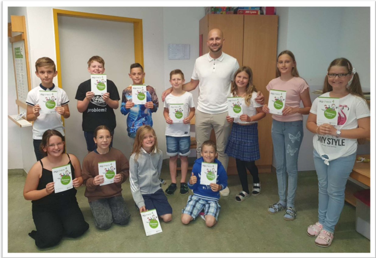
VS Hengsberg ist Experteschule

Plattformen wie ANTON, Antolin, Onilo oder Padlet. Nach Kontrolle und Bestätigung unserer Einreichung durch unseren Bundeslandkoordinator wurde uns der Status eEducation Expert.Schule verliehen. Digitale Kompetenzen sind im 21. Jahrhundert unverzichtbar und wir sind stolz, diese Auszeichnung mit den Kindern gemeinsam erreicht zu haben.