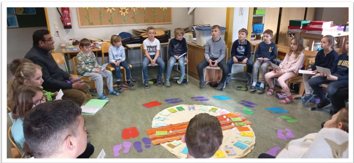
Das größte Geschenk ist die Versöhnung